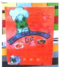
Cosa si mangia?