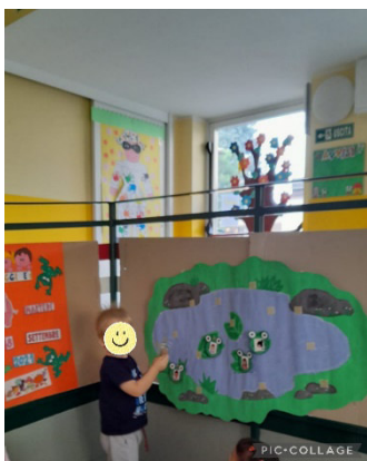
OGGI QUANTI SIAMO?